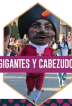
GIGANTES Y CABEZUDOS